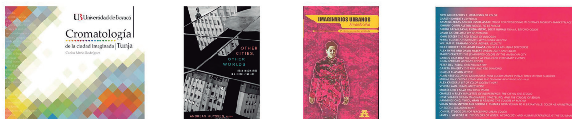
Figura 4. Portadas de publicaciones cuyos enfoques parten desde el estudio de los imaginarios urbanos o la percepción no tangible del color.

El estudio del color imaginado, que responde a las percepciones de los habitantes y las relaciones cognoscitivas existentes entre el entorno y el observador, elacionado con los componentes formales de una ciudad, tales como calles y fachadas.