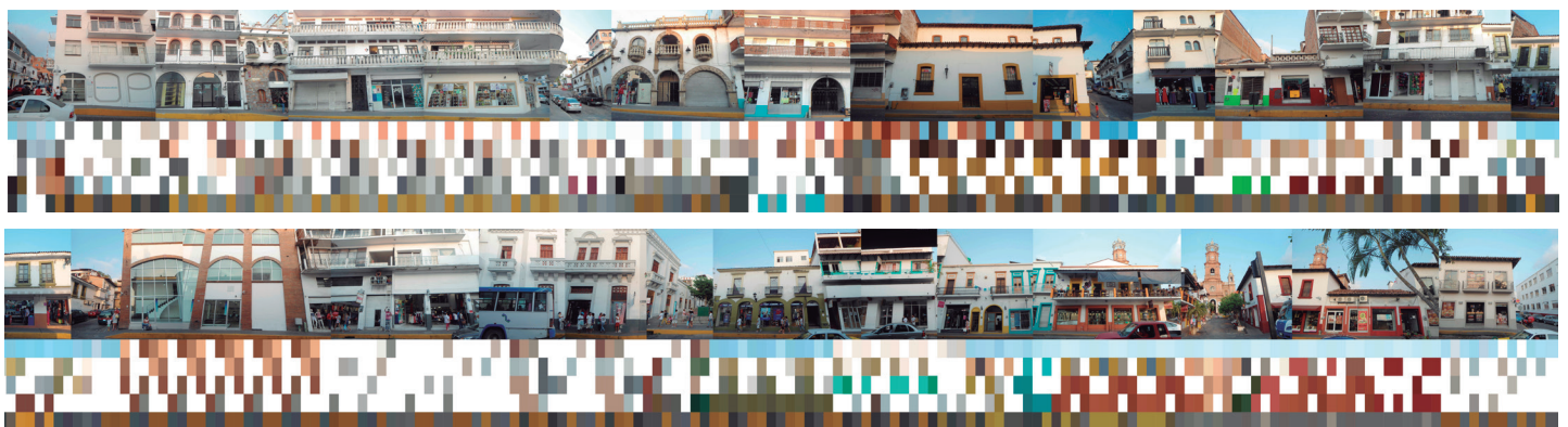
Figura 7. Observación y registro cromático de la calle Juárez. Colonia Centro de Puerto Vallarta.