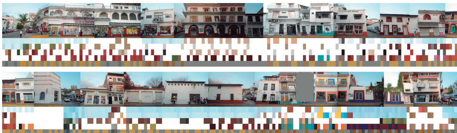
Figura 8. Observación y registro cromático de la calle Juárez. Colonia Centro de Puerto Vallarta.