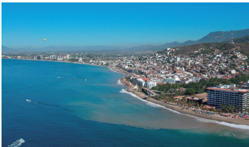
Figura 1. Vista panorámica de la ciudad de Puerto Vallarta.

En la ciudad de Puerto Vallarta se han ido conjugando una serie de elementos que han constituido en conjunto a una de las ciudades turísticas más importantes de México.