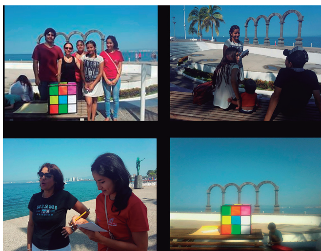
Figura 10. Análisis cualitativo del color "imaginado". Malecón de Puerto Vallarta. Fuente: elaboración propia.

Para el análisis cualitativo del color imaginado se plantea el abordaje desde entrevistas a informantes claves, encuestas y etnografía visual. En las imágenes siguientes se encuentran algunas escenas del trabajo de campo en donde se comienza a entrevistar a los habitantes de las mismas zonas seleccionadas para el registro cromático físico, sobre la identificación de Puerto Vallarta con sus colores desde su percepción y significación cultural.