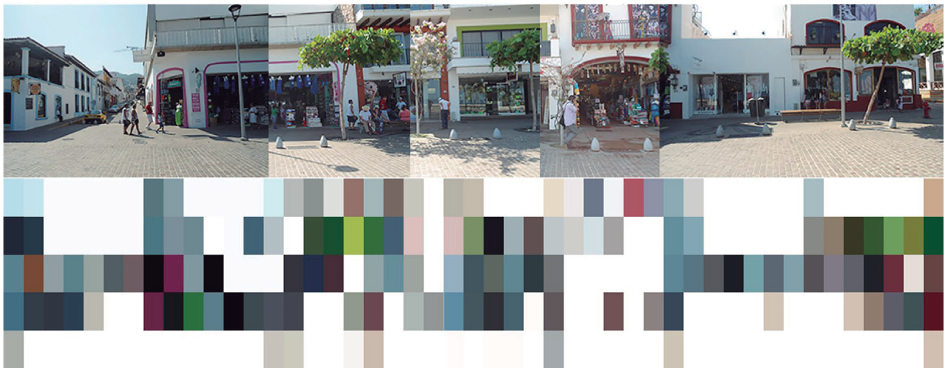
Figura 6. Observación y registro cromático del Malecón de Puerto Vallarta.