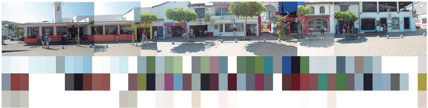
Figura 5. Observación y registro cromático del Malecón de Puerto Vallarta.