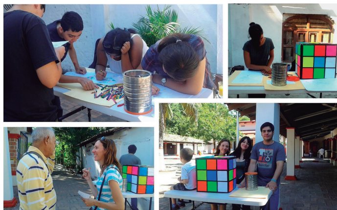
Figura 13. Análisis cualitativo del color “imaginado”. Isla Río Cuale, Puerto Vallarta.