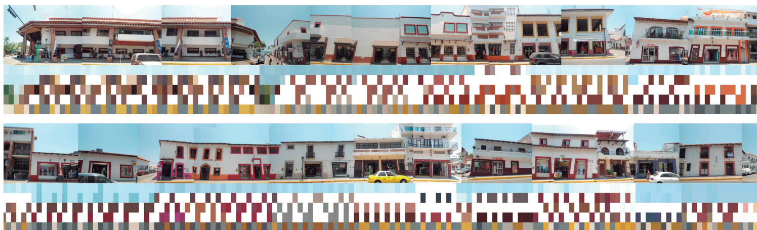
Figura 9. Observación y registro cromático de la calle Juárez. Colonia Centro de Puerto Vallarta.