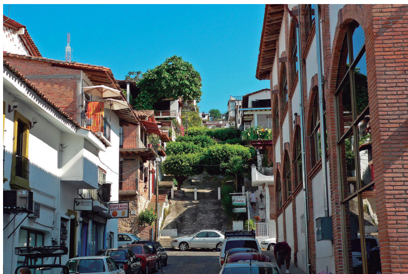
Figura 2. Imagen del centro de Puerto Vallarta.

Puerto Vallarta, destino turístico reconocido mundialmente, ha pasado entonces por diferentes etapas que encuadran el esquema cualitativo por el que han pasado muchos pueblos y ciudades, áreas y zonas naturales que son parte del mercado turístico mundial.