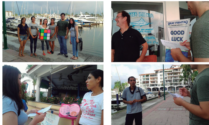
Figura 12. Análisis cualitativo del color “imaginado”. La Marina, Puerto Vallarta.