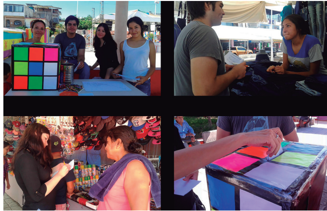
Figura 11. Análisis cualitativo del color “imaginado”. Plaza del Pitillal, Puerto Vallarta.