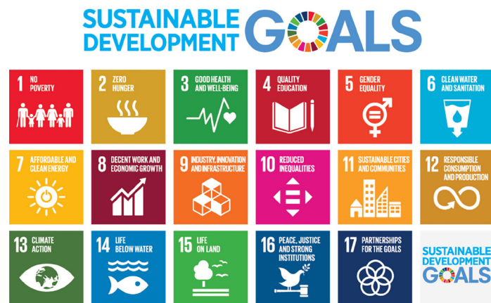
Figura 1. Objetivos de desarrollo sostenible.

que no necesariamente incluye un diálogo en el proceso comunicativo, sino que comunica un mensaje. Hay obras de referencia que transportan el sonido, los ritmos y la música a composiciones visuales y que hacen referencia a este contexto, como las obras de Jack Ox, Yasunao Tone o Ernest Edmonds (Edmonds & Pauletto, 2004). La comunicación de una canción dirigida al conocimiento de los Objetivos de Desarrollo Sostenible (figura 1). El Objetivo de Desarrollo Sostenible número cuatro, Educación de Calidad, pretende garantizar el acceso a una educación inclusiva, de calidad y equitativa y promover oportunidades de aprendizaje permanente para todos (Naciones Unidas, 2022). La música fue entendida como un medio de comunicación y una forma de promover el debate sobre los derechos humanos, la igualdad de género, una cultura de paz y no violencia, la ciudadanía global y la valoración de la diversidad cultural.