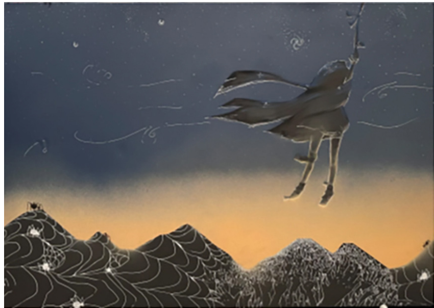
Figura 11. Comunicación visual de la canción “Easy To Fall” de Paris Shadows.

La obra Can You Feel My Heart del grupo Bring Me The Horizon también representa una caída, pero más concretamente un ahogamiento. Las emociones expresadas de soledad, desesperanza y miedo son presentadas por el dibujo en líneas de animales (demonios) que rodean al personaje central. Hablar y ser consciente de los problemas y emociones que se viven en la vida cotidiana son bases de la ciudadanía y de la convivencia de las personas. Esta obra también tiene una lectura vertical (de arriba hacia abajo), el equilibrio es simétrico y su movimiento se expresa por el ritmo de las líneas y el final por la muerte (renunciar a vivir) en la parte final.