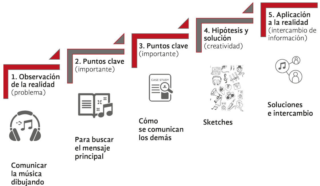
Figura 3. Adaptación de la metodología de enseñanza activa con el Arco de Magarez con el ejercicio de comunicación gráfica a través de la música.

La presentación estaba destinada a los alumnos de la clase y al equipo de profesores. La presentación comenzó con la parte visual comunicada sin palabras — la composición visual y, posteriormente, con el audio puesto (la música con el verbo).