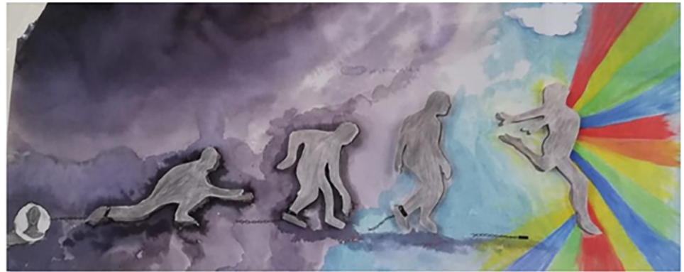
Figura 6. Comunicación visual de la canción “Livre” de Mastiksoul y Mariza.

La figura 6 expresa claramente la liberación, la evolución de un personaje, que se ata a una cadena y se libera, provocando un arcoíris de colores. La música portuguesa Livre interpretada por Mastiksoul y Mariza hace referencia a este sentimiento de libertad, en términos de derechos humanos. Se utilizaron colores para simbolizar este cambio así como la repetición del personaje central con las distintas posiciones anatómicas. La explosión de colores y la verticalidad de la composición potencian esta misma lectura.