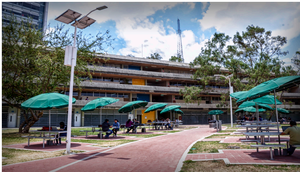
Figura 9. Ciberjardín en donde los estudiantes pueden trabajar con acceso a internet.

la señal en el ciberjardín del campus. Actualmente el proyecto de red inalámbrica contempla contar con un equipo de acceso a internet por cada aula, para brindar este servicio a todos los dispositivos que se encuentren dentro del campus.