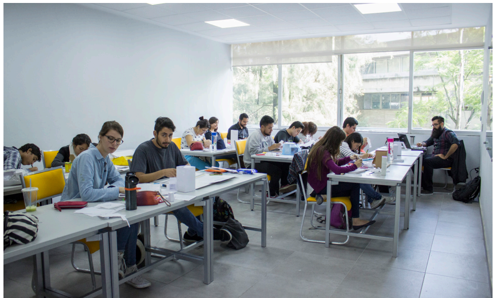
Figura 2. Alumnos de la materia de Diseño VII de la Licenciatura en Diseño para la Comunicación Gráfica.

La Universidad de Guadalajara, la universidad pública del estado de Jalisco, está constituida por centros universitarios regionales y temáticos. Los primeros se encuentran fuera de la zona metropolitana de Guadalajara y tienen diversas licenciaturas, de acuerdo con de las necesidades de cada región, mientras que los segundos se encuentran en la zona metropolitana de Guadalajara y agrupan licenciaturas de áreas disciplinares semejantes. Este es el caso del Centro Universitario de Arte, Arquitectura y Diseño (CUAAD) que alberga nueve licenciaturas, entre las cuales se encuentra la Licenciatura en Diseño para la Comunicación Gráfica (LDCG).