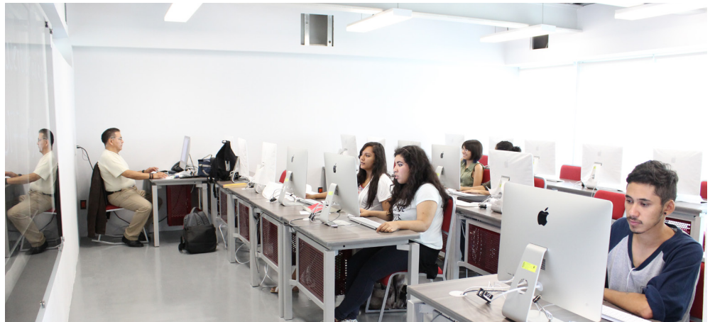
Figura 5. Ejemplo de aula para asignaturas teórico-prácticas.

En el proyecto de infraestructura tecnológica el objetivo fue solucionar esta problemática, además de implementar nuevas herramientas, que al integrarse en las clases apoyaran en la mejora del proceso de enseñanza-aprendizaje, tomando en cuenta también una mejora en la infraestructura física.