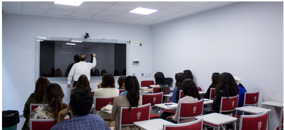
Figura 6. Pantalla en aula multimedia, con soporte de vidrio para escribir, en lugar de pintarrón o pizarrón.

Las pantallas adquiridas cuentan con puertos de transmisión de audio y video de alta definición en dimensiones de 80 y 75 pulgadas. Están equipadas con interfaces de conexión de video VGA y HDMI con audio de alta definición, además de un puerto RS232 para control y mini plug para audio.