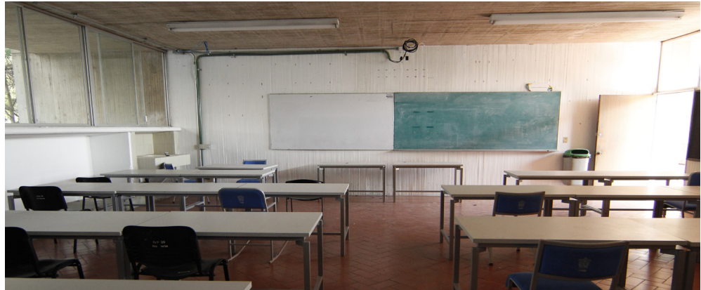
Figura 3. Ejemplo de aula antes de la intervención.