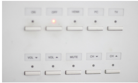
Figura 7. Botonera para la interconexión con la pantalla.

A través de una placa de control con 10 botones programables instalada ergonómicamente en el espacio del profesor se enciende y apaga la pantalla, se controla el volumen y la selección de entrada de video, con funciones reservadas para futuros proyectos. Además, se cuenta con una placa de conexiones, en donde mediante cables VGA o HDMI se conectan los equipos de cómputo y otros dispositivos electrónicos.