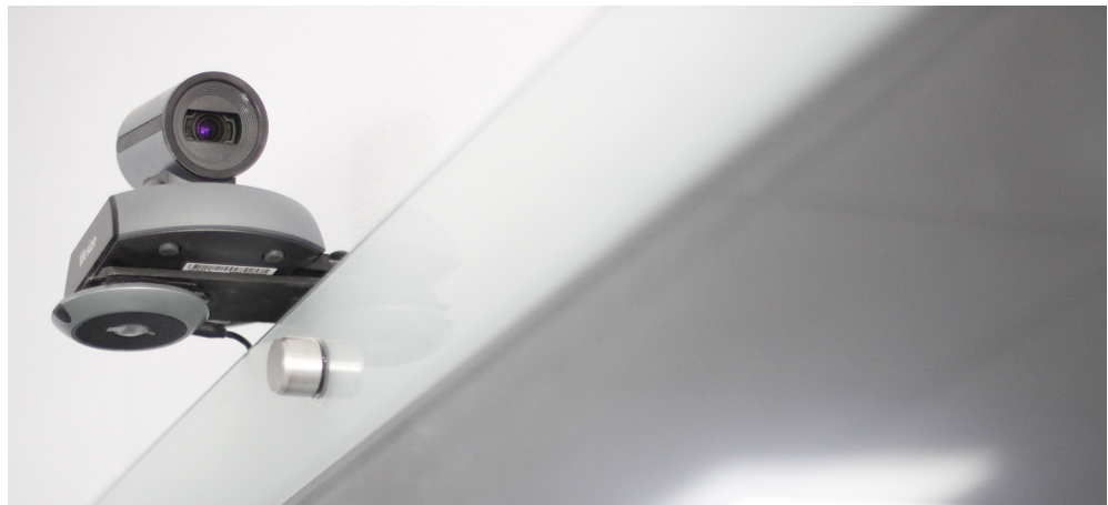
Figura 8. Equipo para la realización de videoconferencias. Fuente: Coordinación de Tecnologías para el Aprendizaje, 2016.

Con esta implementación se acercan a los alumnos ponencias en cualquier momento, sin necesidad de trasladar al conferencista al centro universitario. Otra ventaja es que el docente provee servicio en línea a los alumnos que por alguna circunstancia estén ausentes.