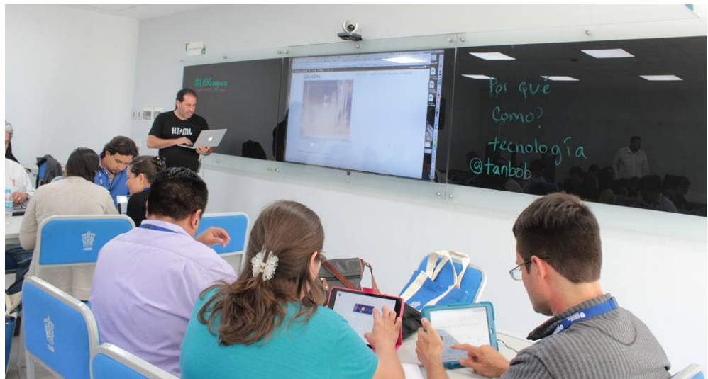
Figura 1. Profesor y estudiantes colaborando en un aula multimedia.

La interactividad profesor-alumno y alumno-alumno y, desde nuestra perspectiva, profesor-alumno-TIC, conducen hacia un proceso compartido, en el cual se encuentran los significados y los conocimientos que finalmente abonan a esta construcción del aprendizaje (Baelo, 2008).