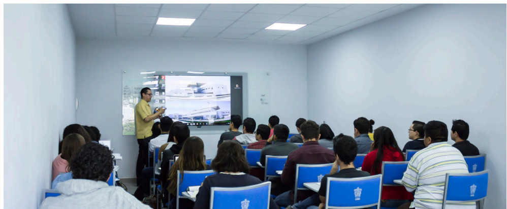
Figura 4. Ejemplo de aula para asignaturas teóricas.

A partir de 2014 el CUAAD, en atención al cumplimiento de sus funciones sustantivas y adjetivas como institución de educación superior, gestionó una infraestructura tecnológica robusta que respondiera a las necesidades de su comunidad académica. En este tenor el centro universitario realizó renovaciones orientadas a la infraestructura tecnológica, como fortalecer el servicio de red e implementar laboratorios y equipo de cómputo, entre otras.