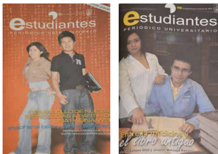
Figura 7. Portada Periódico Estudiantes (mayo y noviembre de 2009).

A mediados del 2005 se evidencia un cambio en los lineamientos para la selección de las portadas en el Periódico Estudiantes : entonces se eligen a estudiantes que han sobresalido en los ámbitos académicos, culturales o deportivos. Las mujeres aparecen generalmente en fotografías tomadas exprofeso para la ocasión. Aunque parecieran tomas frescas y cotidianas, podemos apreciar en la figura 7 coincidencias en las imágenes de estas portadas. En ambas se ve una pareja que ha destacado en el ámbito académico donde existe una relación de pares; sin embargo, la posición que ocupan en la toma muestra a ambas mujeres en segundo plano. Además, los hombres aparecen en una pose natural dentro de la imagen, mientras que las mujeres lucen “acartonadas”.