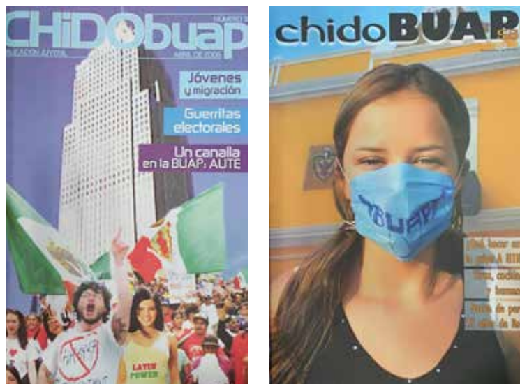
Figura 6. Periódico CHIDO, portadas (abril de 2006 y abril de 2008).

Las mismas directrices aplicaron para el Periódico CHIDO , el cual en ese periodo también muestra a mujeres elegidas con características físicas que exacerbaban los cuerpos delgados, atléticos y blancos, y presentan la belleza como una condición inherente a las mujeres, atributos todos ellos que son aceptados y altamente difundidos por los medios de comunicación.