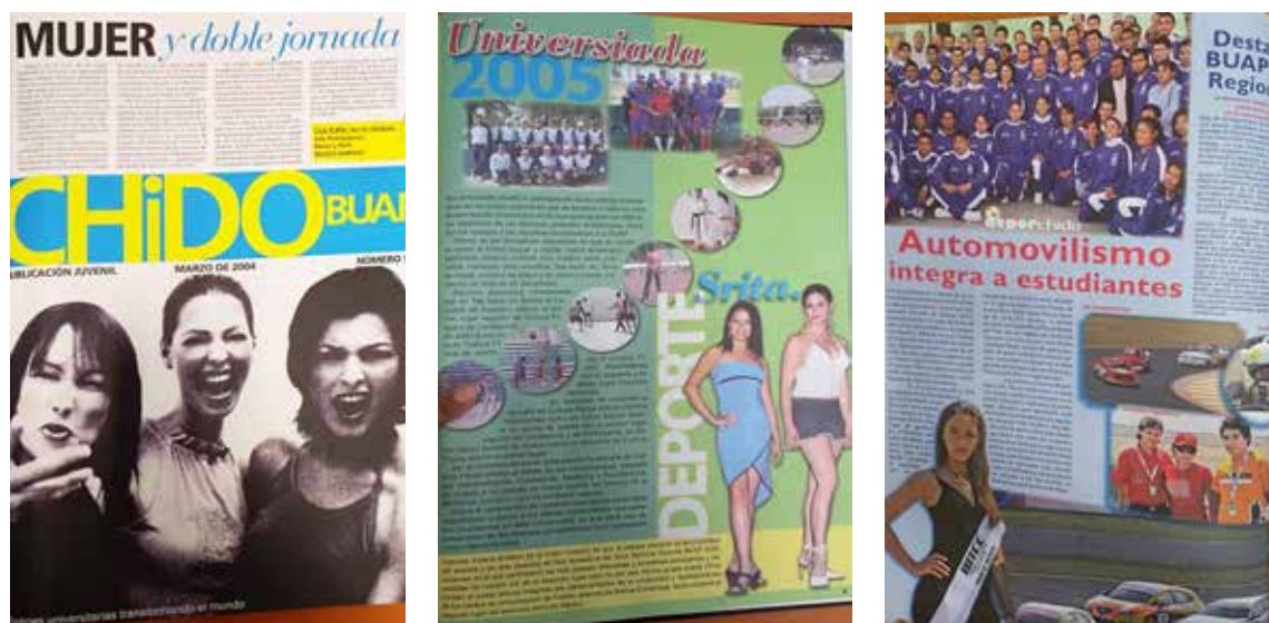
Figura 2. Periódico CHIDO, portada (marzo 2004) e interiores (noviembre de 2005 y marzo de 2009).