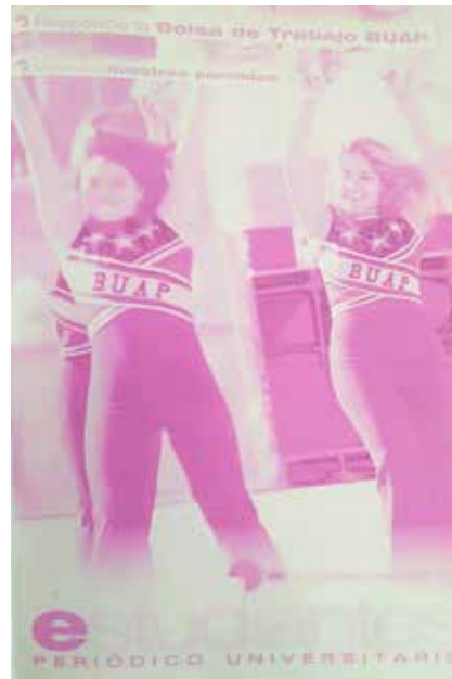
Figura 1. Portada Periódico Estudiantes (marzo de 2003).