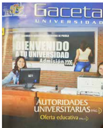
Figura 3. Portada Gaceta UNIVERSIDAD BUAP (julio-agosto de 2006).

estudiante escribe un mensaje de bienvenida, se trata de una mujer sin rostro cuyo cuerpo resalta por la ropa ajustada que lleva puesta.