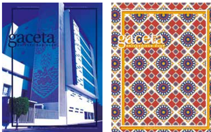
Figura 9. Portada Gaceta UNIVERSIDAD BUAP No. 201 (marzo de 2016) y No. 220 (2017).

en las distintas dependencias administrativas de la BUAP. Debemos recordar además que la Gaceta UNIVERSIDAD BUAP es uno de los puentes de comunicación de rectoría con la comunidad universitaria. De ahí que las portadas en este periodo sean sobrias e institucionales, alejadas de cualquier representación que pudiera cuestionar el compromiso con la equidad de género. Después, para inicios de 2017, las ilustraciones abstractas hicieron su aparición (véase portada No. 220 en figura 9).