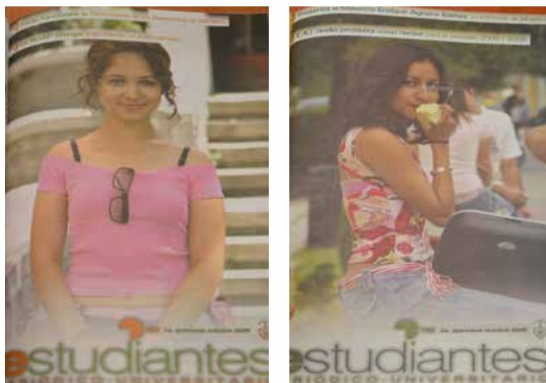
Figura 5. Portada Periódico Estudiantes (1ª y 2ª quincenas de octubre de 2005).

Las mismas directrices aplicaron para el Periódico CHIDO , el cual en ese periodo también muestra a mujeres elegidas con características físicas que exacerbaban los cuerpos delgados, atléticos y blancos, y presentan la belleza como una condición inherente a las mujeres, atributos todos ellos que son aceptados y altamente difundidos por los medios de comunicación.