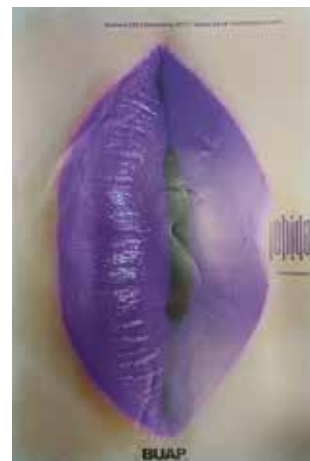
Figura 11. Periódico CHIDO, portada (diciembre de 2017).

Por otra parte, para el periodo 2013-2017, la línea editorial enfocada en el arte y la cultura del Periódico CHIDO regresa progresivamente. En este periodo la cultura pop se hace presente al mostrar temas de interés para los estudiantes universitarios, como series, cine, música, literatura, arte, sociedad, entre otros. Las portadas son visualmente muy llamativas, cuidando cada detalle en sus aspectos morfológicos y compositivos, pero también semánticos. Sólo hay una portada que hace referencia a las mujeres mediante el movimiento social del feminismo. Para ese año (2017), la BUAP cuenta con el Comité para la Promoción de Igualdad Sustantiva en la BUAP (creado en 2016) y, desde 2014, con la Coordinación de Igualdad e Inclusión a cargo del Programa de Atención a la Igualdad. Así, las diversas coordinaciones, los grupos de investigación y las dependencias universitarias empujaron las políticas de transversalización de género que contribuyeron al cuidado de las representaciones sobre las estudiantes universitarias.