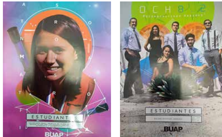
Figura 8. Portadas Periódico Estudiantes (octubre y noviembre-diciembre de 2017).