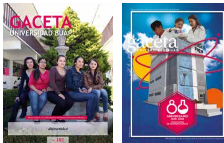
Figura 4. Portadas Gaceta UNIVERSIDAD BUAP (agosto de 2014 y noviembre de 2018).

Por otro lado, en 2018 se combinó fotografía e ilustración para presentar ocasionalmente a integrantes de la comunidad universitaria. El ejemplo presentado en el número 230 de este medio es relevante, toda vez que presenta narrativas en torno a estudiantes mujeres en ámbitos científicos, actividades dominadas por los varones. Sin embargo, estas narrativas son la excepción a la regla, su aparición es ocasional.