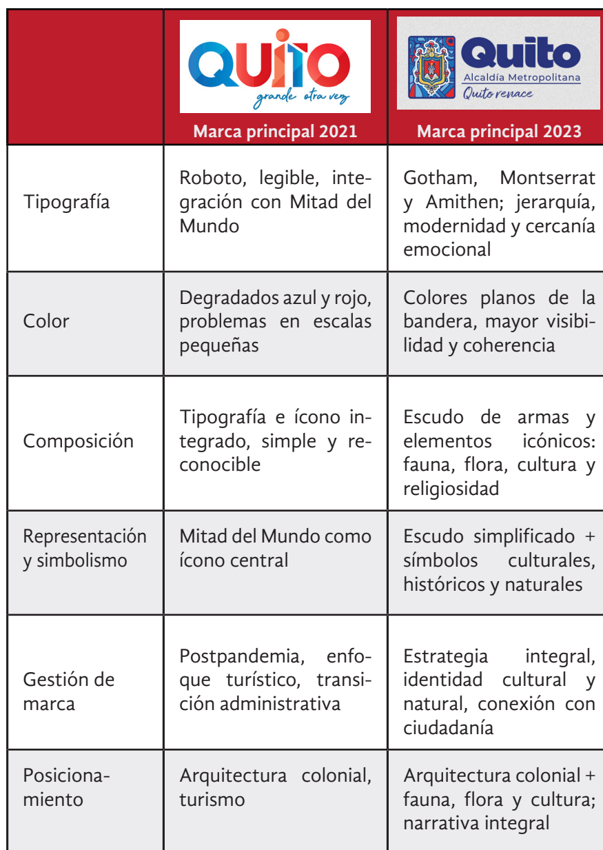
Tabla 4 Análisis comparativo de casos

De manera posterior, se llevó a cabo un análisis comparativo entre las marcas de 2021 y 2023, utilizando la misma estructura categórica. Este procedimiento permitió observar similitudes y diferencias en los elementos visuales, la narrativa simbólica y las estrategias de posicionamiento utilizadas en cada caso. El análisis comparativo facilitó comprender cómo los cambios administrativos y los contextos políticos influyeron en la transformación de la identidad visual de la ciudad y en las estrategias de comunicación empleadas por la administración municipal (véase la tabla 4).