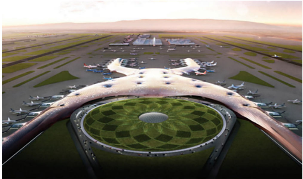
Figura 3. Vista aérea del proyecto del NAICM.

como afectaciones de orden social, históricas y del paisaje cultural. Además, de múltiples denuncias de prácticas de corrupción en la asignación y ejecución de la obra. Debido a estos factores, se decidió la cancelación definitiva de la obra a pesar de los avances en la construcción y de sus altos costos financieros.